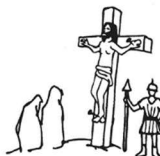
Karfreitag: Das Leben hinsetzen.